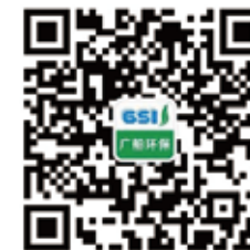
广船环保微信公众号二维码

同学们可以通过关注广船环保微信公众号进行分类数据及积分查询。微信公众号还会经常给同学们推送垃圾分类相关推文，并不定期开展积分赠送活动哦！