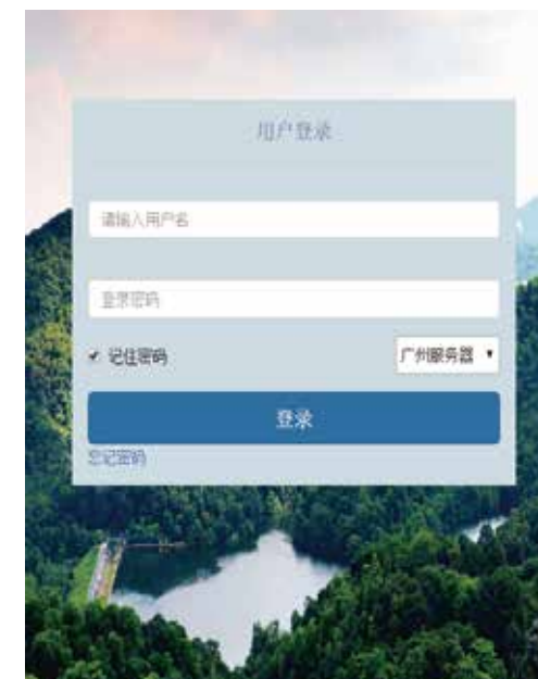
垃圾分类积分查询界面（初始用户名及密码均为学号）